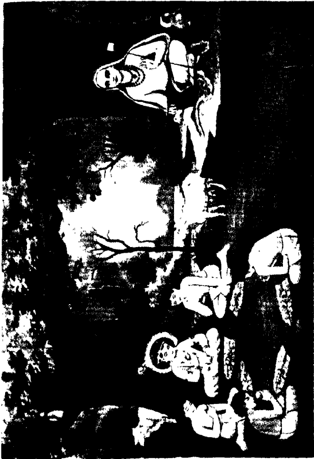
श्रीलंका के श्वेत वाण-कृष्ण